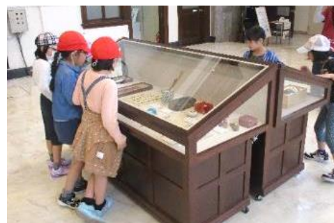
▲ 記念企画展No.1「坂口謹一郎博士のあゆみ展」