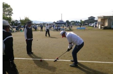
▲ シニアゲートボール大会の様子

社会福祉施設の整備に活用してほしいとご希望された方からの寄附金につきましては、将来的な社会福祉施設の整備に要する資金として活用させていただくため、「上越市社会福祉施設整備基金」に積立てさせていただきました。