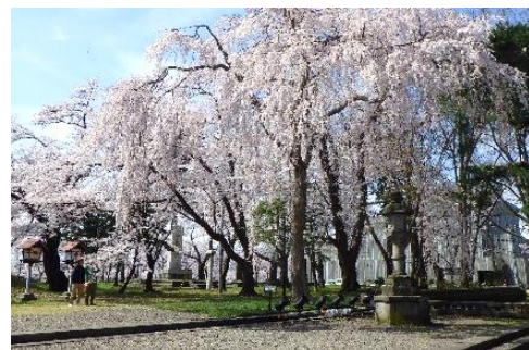
▲ 忠霊塔前シダレザクラの開花状況

また、市民の皆様との協働プロジェクト「桜プロジェクトJ」では、桜のお礼肥え（開花後の施肥）、腐葉土を用いた土壌改良、講習会等の活動を年7回実施するなど、上越市の大切な資産であり、貴重な観光資源である高田公園の桜を100年後の未来まで伝えるため、官民一体となって取り組みました。