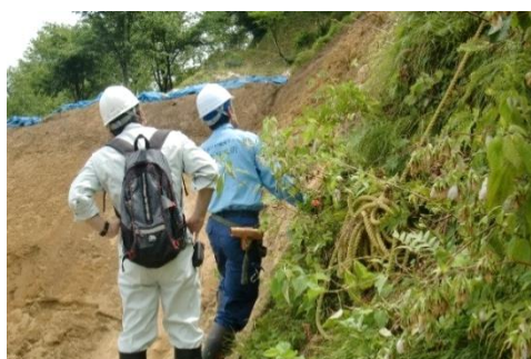
▲ 土木・地質の有識者による現地指導