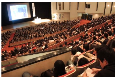
▲ 坂口謹一郎博士生誕 120 年記念フォーラム

ノーベル生理学・医学賞受賞者の大村智先生からご講演をいただいた「坂口謹一郎博士生誕 120 年記念フォーラム」の開催や、2 回にわたる「記念企画展」の開催を通じて、坂口博士の業績や人となりを幅広く発信することができたほか、地域への誇りや、子どもたちの科学への夢や興味を育てる機会とすることができました。