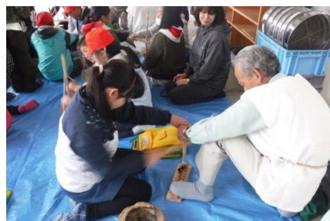
▲ 吹上・釜蓋遺跡応援団の活動（ものづくり指導）