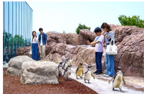
▲ マゼランペンギンミュージアム