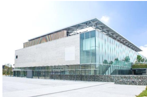
▲ 上越市立水族博物館うみがたり外観

オープンからの連日、大勢の来館者をお迎えしており、今後も「うみがたり」に何度も足を運んでいただけるよう、さらに展示の工夫や教育・普及活動に努めてまいります。