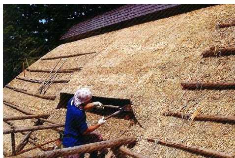
▲ 林富永邸 茅葺き屋根葺き替え作業