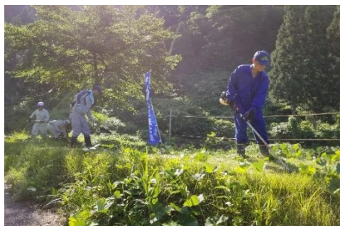
▲ 中山間地域支え隊 牧区高尾での草刈り