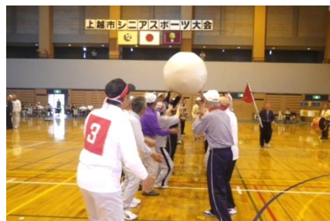
▲ シニアスポーツ大会の様子

スポーツや趣味活動などを通じ、参加者同士の交流や世代間交流を深め、高齢者の生きがいと健康づくりを進めることができました。