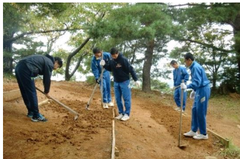
▲ 土の一袋運動の様子（本丸の修復）

また、市民団体や地元小中学校との協働による維持管理活動（土の一袋運動や松葉かきなど）の取組を通し、城跡の保護と合わせて、郷土の史跡への愛着を深めることができました。