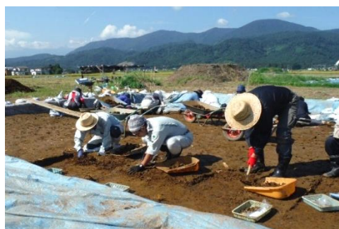
▲ 大学生と共同での発掘調査

また、遺跡を活用した取組では、吹上・釜蓋遺跡応援団主催による遺跡まつり（年2回）の実施や、釜蓋遺跡ガイダンス定期講座の開催などにより、多くの方に釜蓋遺跡の魅力や埋蔵文化財に関する情報などを発信することができました。