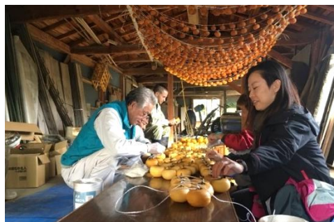
▲ 地域おこし協力隊 地域の取組支援

中山間地域支え隊事業では、集落行事や共同作業の実施が困難な中山間の集落に対し、市内の企業などから延べ 127 人のボランティアを派遣し、行事や作業の実施を市全体で応援しました。