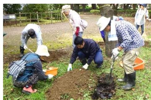
▲ 桜プロジェクトJ活動風景（土壌改良）